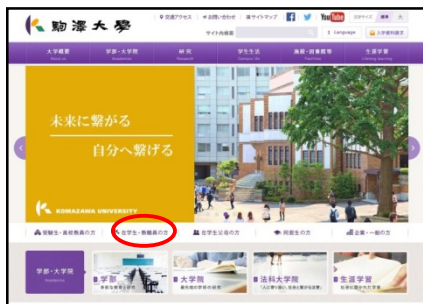
大学HP「在学生・教職員」ページ下部 リンク「C-Learning (学生用)」